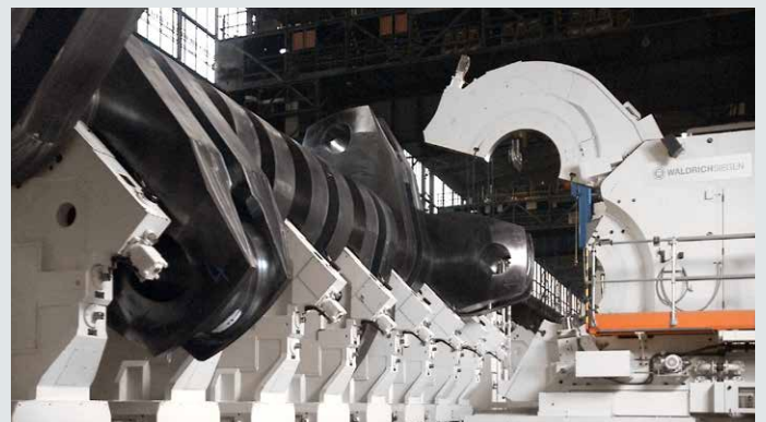
Kurbelwellendrehmaschine von WaldrichSiegen