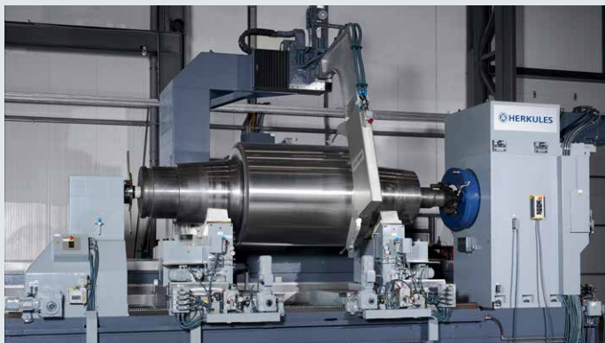
Walzenschleifmaschine von Herkules