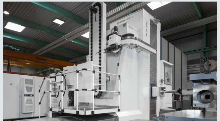
Bohrwerk der Marke Union